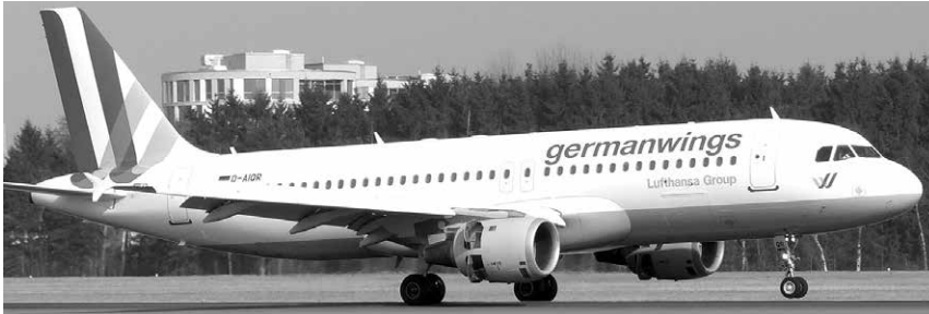
Das Foto zeigt einen Typ der Unglücksmaschine des Germanwings-Flug 4U9525

Fassungslosigkeit, Entsetzen, Schmerz: Der Schock über den Flugzeugabsturz in den französischen Alpen sitzt tief. 150 Menschen verloren ihr Leben, viele kamen aus Deutschland und Spanien. „In diesen schweren Stunden sind meine Gedanken bei den Angehörigen und Freunden der Opfer“, zeigte sich Landesgruppenvorsitzende Gerda Hasselfeldt fassungslos.