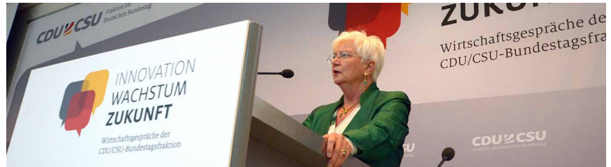
Gerda Hasselfeldt: „Wir nehmen die Sorgen der Menschen ernst.“

Bei TTIP gehe es aber nicht nur darum, die großen Chancen zu nutzen, sondern in den Verhandlungen auch