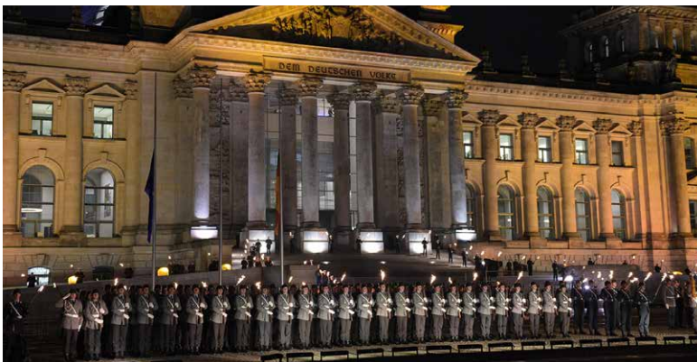
Großer Zapfenstreich anlässlich 60 Jahre Bundeswehr vor dem Reichstagsgebäude

60 Jahre Bundeswehr: ein Grund zum Feiern. Denn die Truppe ist ein tragender Pfeiler der freiheitlich-demokratischen Grundordnung. Am Donnerstag hat der Deutsche Bundestag in einer Debatte an die wechselvolle Geschichte der Bundeswehr erinnert.